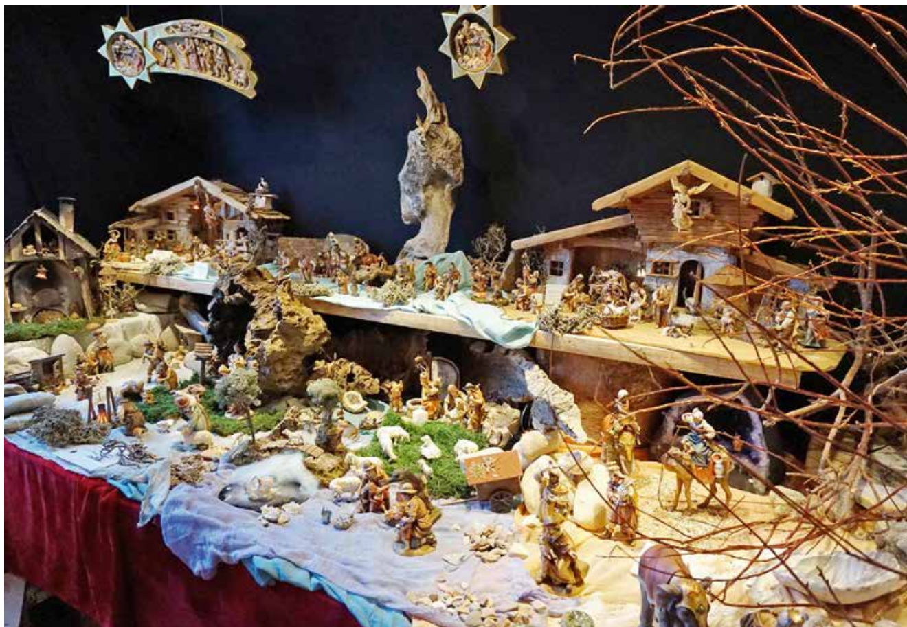
Zahlreiche, kunstvolle Krippen sind im Kunsthandwerkergeschäft „Beim Elle“ zu bewundern.

Wenn die Tage kürzer werden und die Nächte frostiger, dann hat die sogenannte „Stade Zeit“ begonnen. Zart fallende Schneeflocken, kalte Temperaturen, wärmerer Glühwein und Kerzenschein, die Vorweihnachtszeit verbreitet eine ganz besondere Stimmung. Wer sich auf diese besondere Zeit einstellen möchte, findet in Schwangau zahlreiche Möglichkeiten, um Inspirationen zu sammeln, in aller Ruhe zu stöbern oder faszinierende Musik zu genießen.