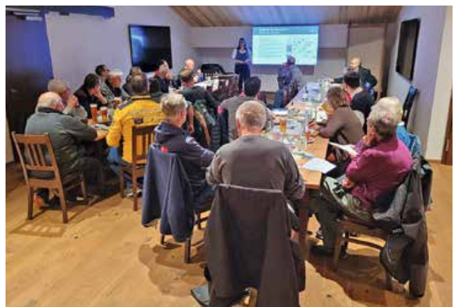
Versammlung der Vereinsvorstände | Das Treffen der Schwangauer Vereinsspitzen begann mit der Finissage der Fotoausstellung „Anno dazumal“. Schwerpunkt des Abends war die Planung der Veranstaltungen im nächsten Jahr. Darunter fallen sämtliche Mitgliederversammlungen der Vereine, Sommerfeste sowie kirchliche Feste und Feiern. Einer der Höhepunkte wird das Aufstellen des Maibaums im Mai durch den Trachtenverein sein.