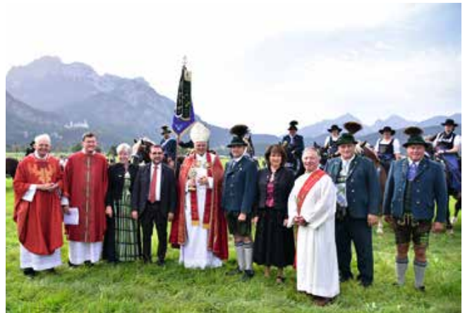
Colomansfest | Am Morgen des Colomansfestes begab sich der Reiterzug vom Rathaus zur Wallfahrtskirche St. Coloman. Dort wurde die Heilige Messe durch den Ausgburger Weihbischof Florian Wörner (5.v.l.) zelebriert. Neben ihm wurden der ehemalige bayerische Gesundheitsminister Klaus Holetschek (4.v.l.) sowie die ehemalige Landtagsabgeordnete Angelika Schorer (3.v.l.) als Ehrengäste begrüßt.