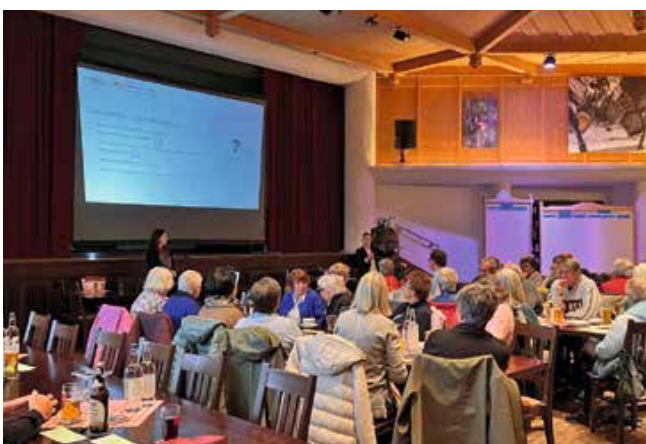
Informations- und Austauschtreffen | Die Gemeinde Schwangau lud ältere Bürgerinnen und Bürger zu einem Treffen ins Schlossbrauhaus ein, um sich gemeinsam zu verschiedenen Themen auszutauschen. Die wichtigsten Wünsche einiger Seniorinnen und Senioren in Schwangau sind zum Beispiel eine aktive Nachbarschaftshilfe, mehr altersgerechtes Wohnen oder eine stationäre Einrichtung für Kurzzeitpflege.