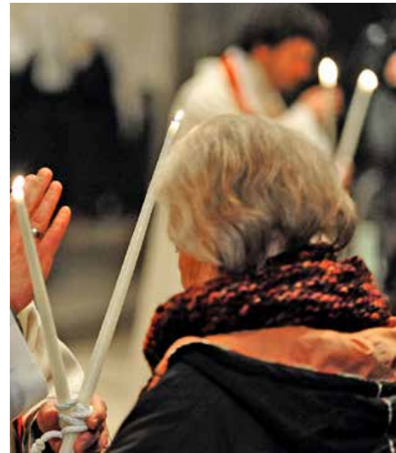
Erteilung des Blasiussegens

Das Segnen der Kerzen ist im Gegensatz zu anderen Bräuchen rund um den Lichtmesstag noch bis heute gängig. Die Licherprozession findet dagegen in den Kirchen kaum noch statt. Auch das Aufstellen der geweihten Kerzen auf den Balken der Häuser ist inzwischen rar geworden. Einst stellten die Kirchenbesucher sie nach dem Gottesdienst weit nach oben, da das heruntertropfende Wachs Glück symbolisierte. Drei Tropfen dieses Wachses haben Gläubige einst kleinen Kindern auf einem Stück Brot verfüttert, um sie vor Krankheiten zu schützen. Nicht nur deswegen wusste der Nachwuchs damals auch noch um die Bedeutung des heute fast vergessenen Tages.