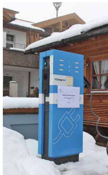
E-Ladestation vor dem Hotel

Nachhaltigkeit wird im Hotel „Das Rübezahl“ im Ortsteil Horn großgeschrieben und es ist für die Betreiberfamilie Thurm nicht nur ein abstrakter Begriff. In den vergangenen Jahren hat die Familie in die Bereiche Energie- und CO 2 -Einsparungen investiert. Mit Erfolg: Bei der Zertifizierung zum Partner des Bayerischen Umwelt- und Klimapakts Ende des Jahres erreichte das Hotel statt der nötigen 100 stolze 253 Punkte.