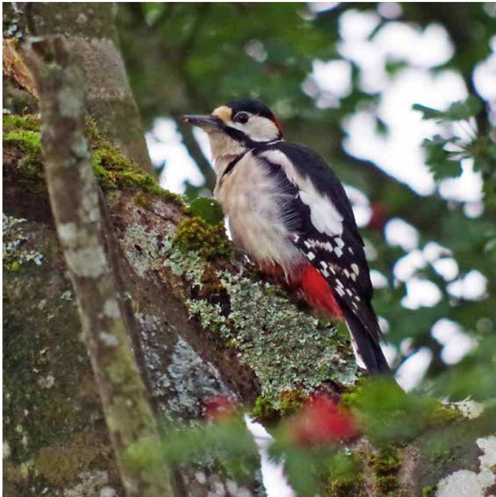
Das Buntspechtmännchen hat einen roten Nackenfleck, der dem Weibchen fehlt.

Das Trommeln im Frühjahr dient der Brautwerbung und der Revierabgrenzung. Dazu suchen sich die Spechte extra Klangkörper, z.B. abgestorbene, trockene Äste auf welchen die Trommelei möglichst laut hörbar ist. Dazu kann auch mal eine alte Dachrinne dienen. Hauptsache, die Damen und eventuelle Rivalen